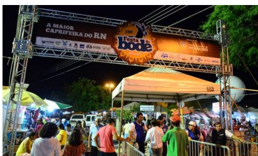
Imagem de edição anterior da festa do bode