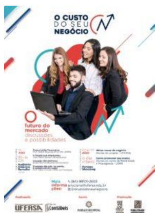
Cartaz do Evento