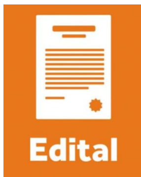
Ilustração de Edital/ Fonte: Portal Ufersa