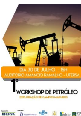
Cartaz do Evento