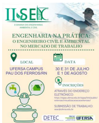
Cartaz do Evento